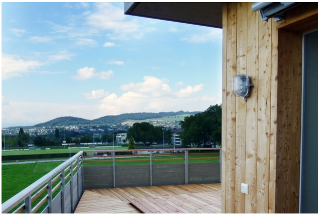
Haus C Terrasse mit Aussicht