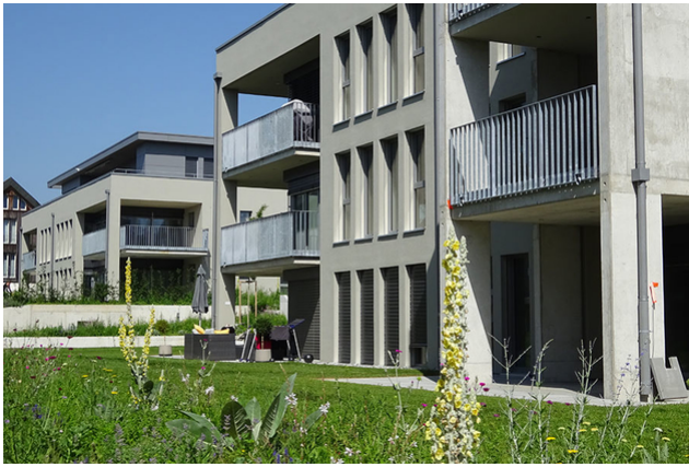
Aussenansicht fertige Überbauung