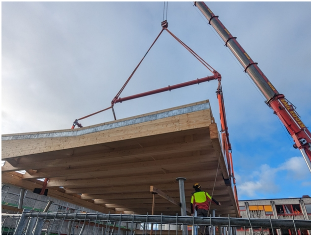
Verlegen der Platten, die auf die Zwischenkonstruktion geklebt werden.